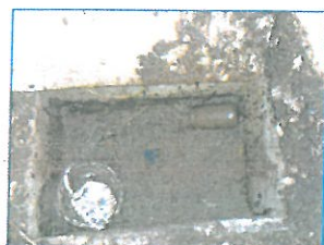
Compteur à nettoyer

Pensez également à vous acquitter de vos factures d'eau avant la fin de l'année 2017.