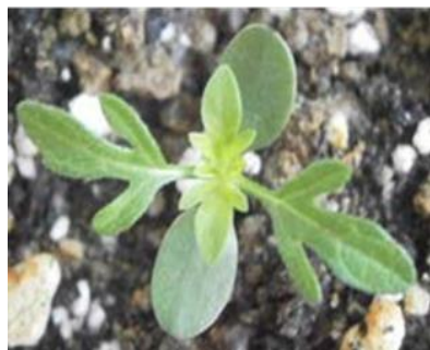
Plant d'ambrosie âgé d'une semaine

La reconnaissance de la plante aux stades précoces est un atout pour lutter rapidement et efficacement en milieu agricole ou en espaces verts.