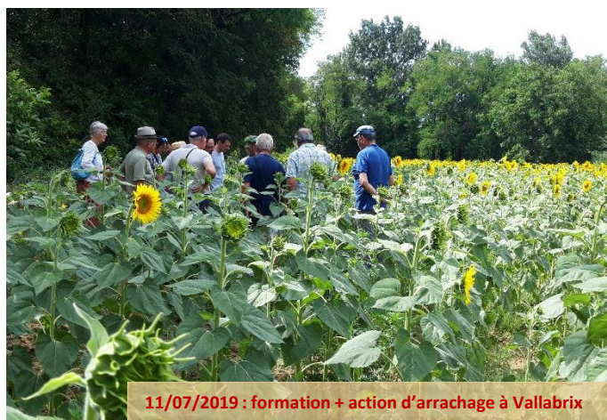
11/07/2019 : formation + action d'arrachage à Vallabrix

Ces formations seront bien sûr ouvertes aux référents qui avaient été formés en 2018 et 2019 s'ils le souhaitent.