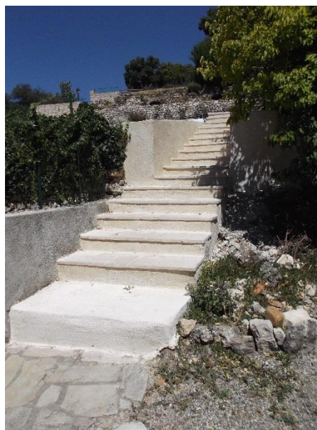
* Parking à côté de l'église