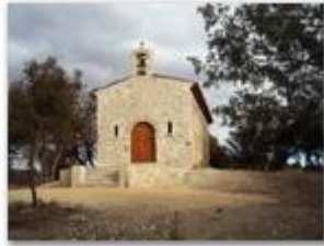
Cérémonie du 29 septembre 2015