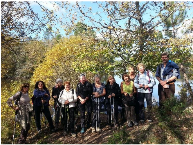
Marche du Souvenir

Photos de nos sorties sur le site de l'ASB83 - Rubrique : Photos