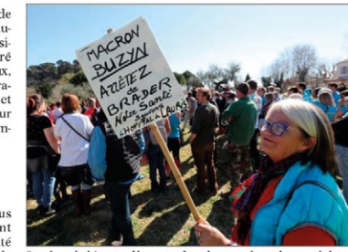
Proches, habitants, élus, et même les membres de son club de course à pied, sont venus encourager le maire avant son départ.

Il y avait aussi un petit groupe de GiletsJaunes, qui ont aidé les membres du personnel de l'hôpital à distribuer des tracts et ont tenté de saisir cette occasion