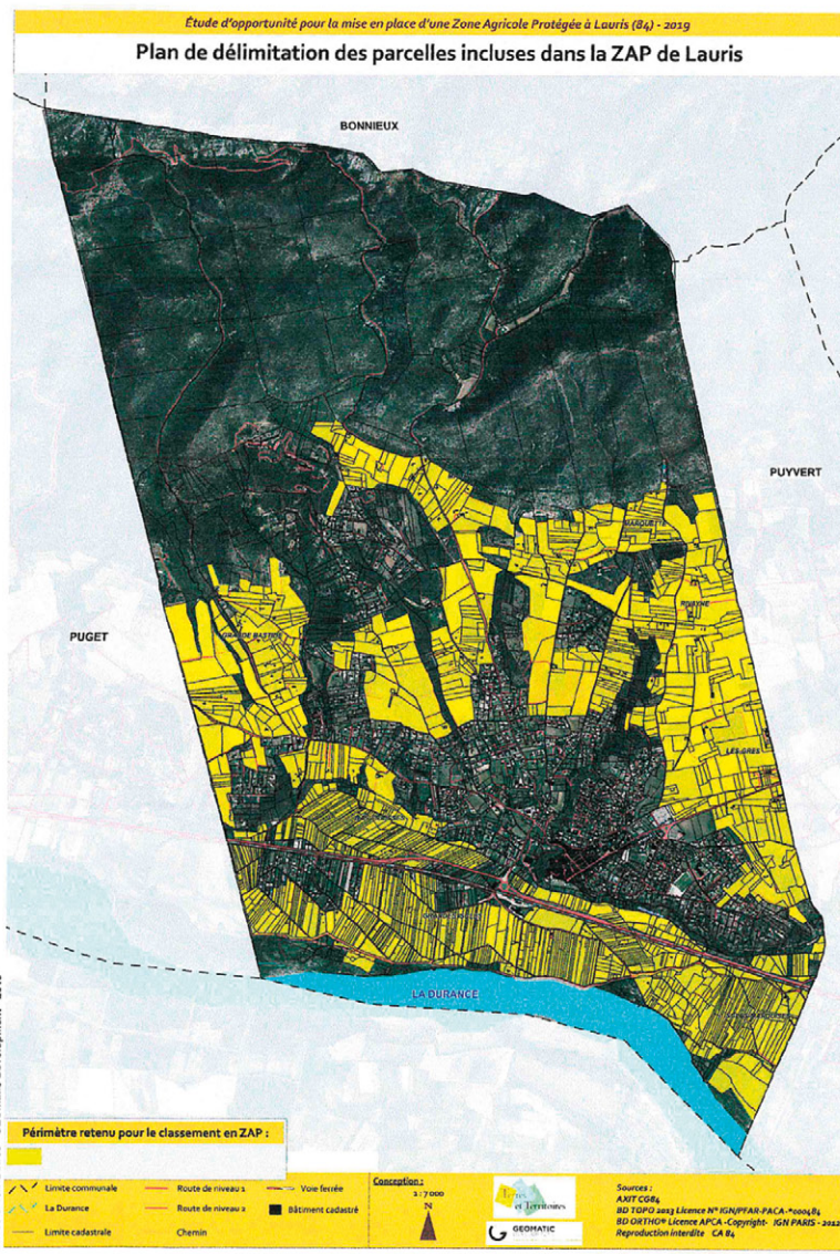
Plan de délimitation des parcelles incluses dans la ZAP de Lauris

Rappel : Disque obligatoire en zone bleue