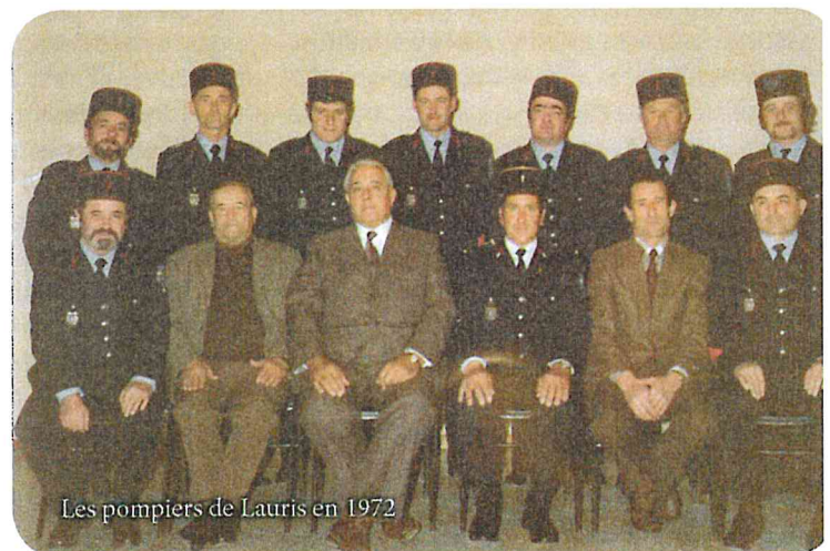
Les pompiers de Lauris en 1972

MAIRIE DE LAURIS Place Joseph Garnier BP 20 84360 LAURIS