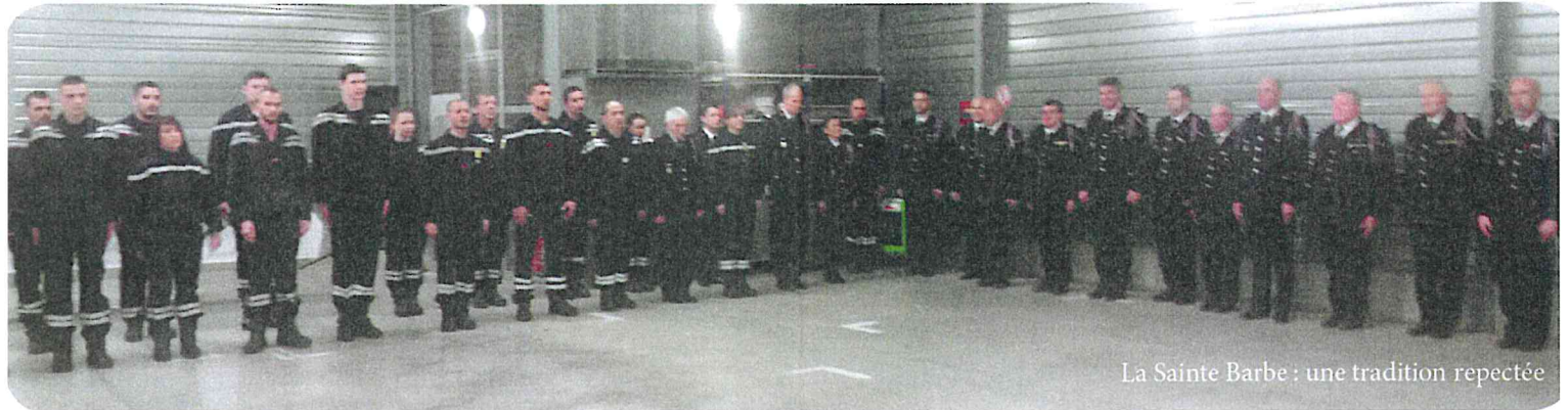
La Sainte Barbe : une tradition respectée