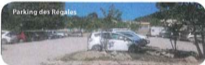
Parking des Régales