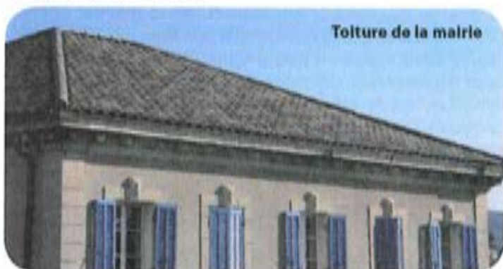
Toiture de la mairie