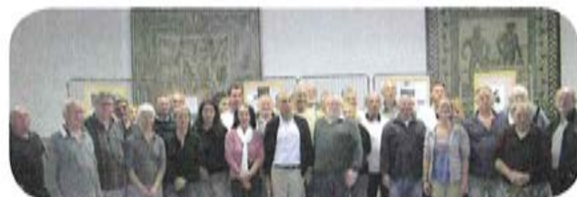
Rassemblement annuel de l'équipe des volontaires des Comités Communaux Feux de Forêts (CCFF) des communes de Lauris, Puget et Puyvert

Gendarmes, pompiers, membres du CCFF viendront présenter les modalités de leurs interventions.