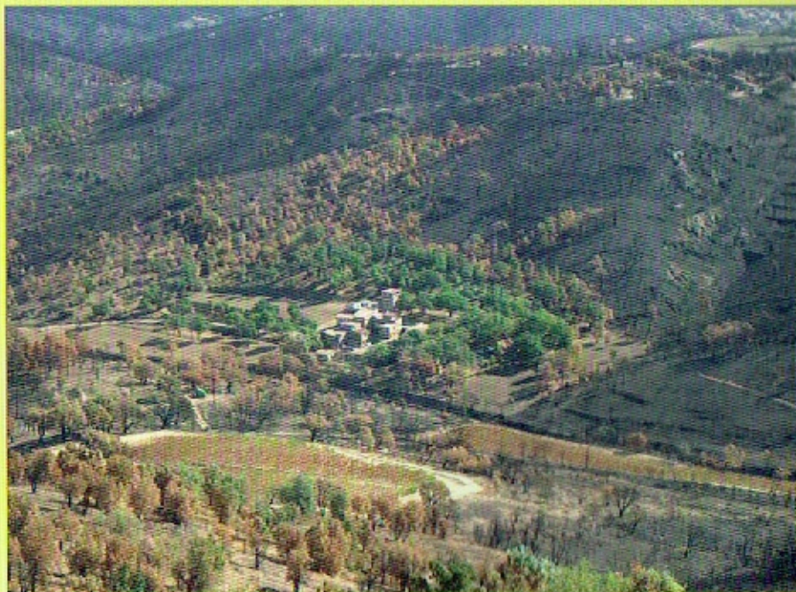
Maisons débroussaillées épargnées par le feu (Plan de la Tour, incendie du 22 juillet 2003).

Le débroussaillage protège la forêt en limitant le développement d'un départ de feu accidentel à partir de votre propriété et en sécurisant les personnels de la lutte contre l'incendie.