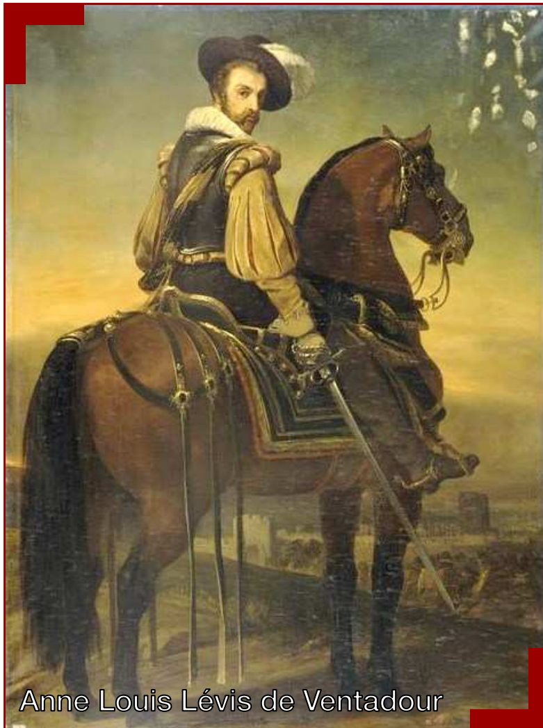
Anne Louis Lévis de Ventadour

Rustrel, où aucun des seigneurs précédents depuis les Agoult Simiane n'étaient jamais venus jusqu'alors.