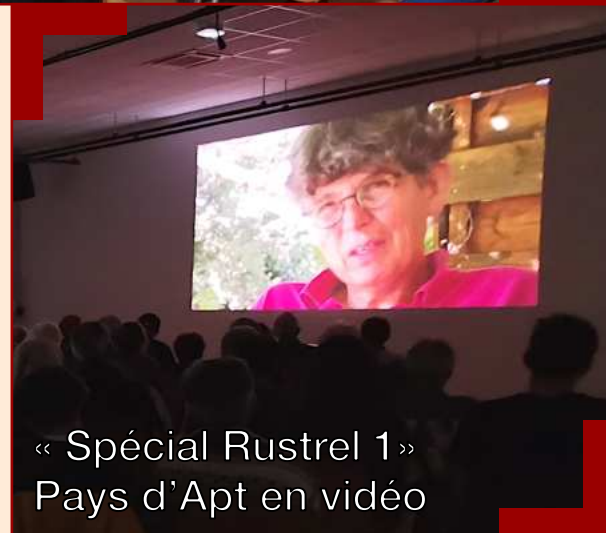
« Spécial Rustrel 1 » Pays d'Apt en vidéo