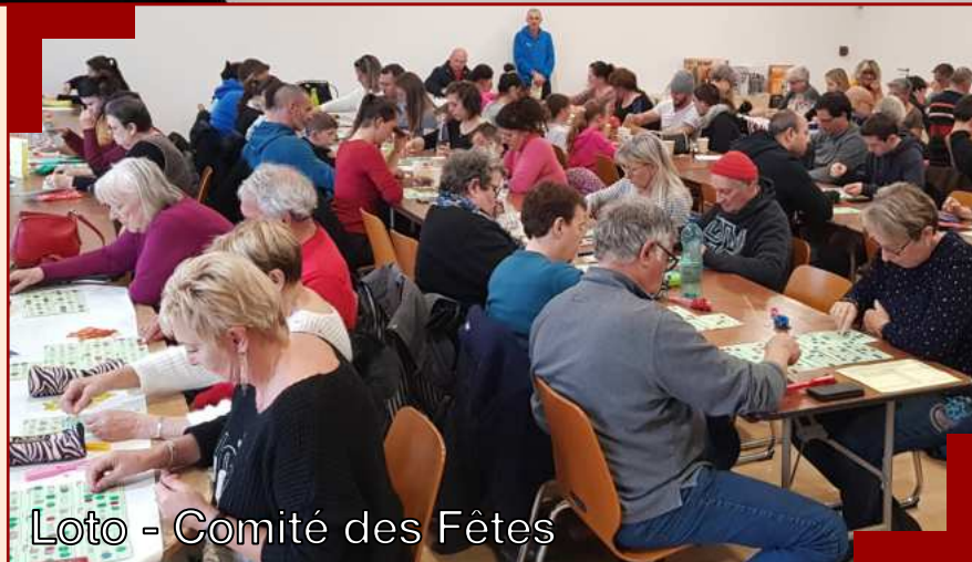
Loto - Comité des Fêtes

C'était aussi l'occasion d'inaugurer de nouveaux éclairages installés à l'ESC, complétant ainsi les équipements sono, installés l'année dernière. ●●●