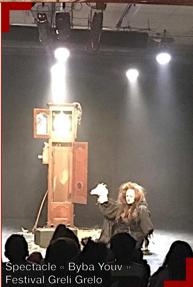
Spectacle « Byba Youv » Festival Greli Grelo

Après ces mois d'hiver bien animés, un programme tout aussi vivant nous attend pour le printemps qui commence, comme en témoigne la liste des événements annoncés en page 12.